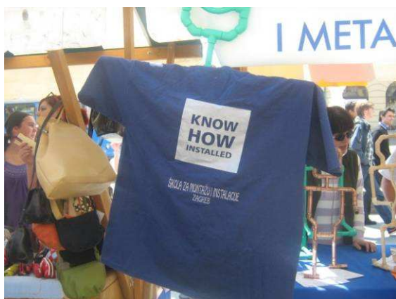
Nema problema – Freaky zna sve!

Poseban događaj je omekšao prof. Janka i on je dozvolio da se najslavnija zahodska školjka u Hrvatskoj pokaže širokoj javnosti. Ravnatelj i pedagogica su jedva dočekali da se slikaju s njom.