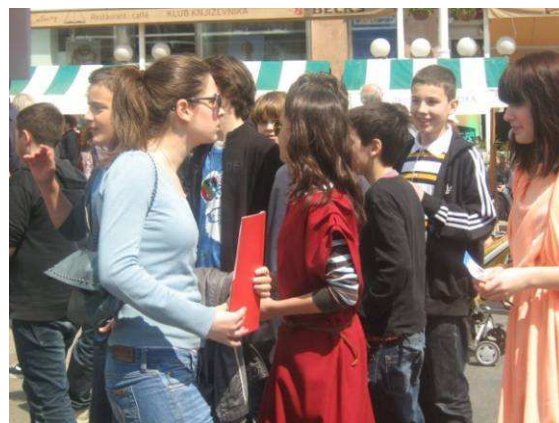
Dečke samo cure zanimaju..