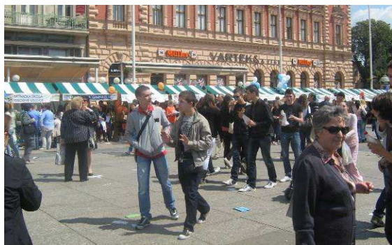
Štandovi škola i kandidati za upis u I. razred

Tradicionalno predstavljanje zagrebačkih srednjih škola ove je godine održano 5.5. Kako je prošlo predstavljanje naše Škole, pogledajte sami!