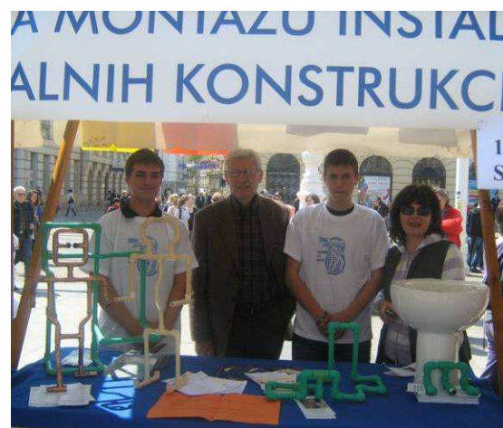
Pozdrav s Trga, vidimo se dogodine!

...a penzioneri žale to su propustili priliku da se na vrijeme upišu u našu Školu.